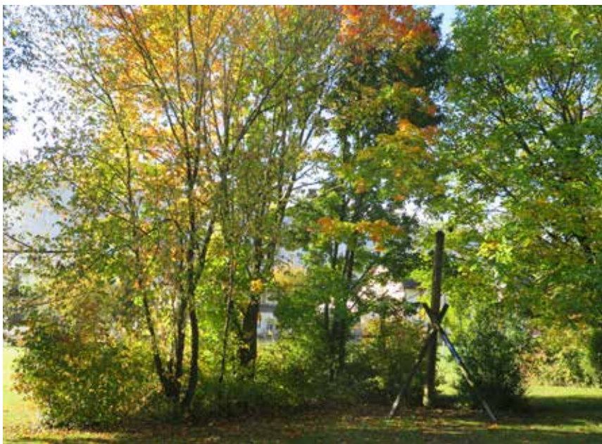
Naturnahe Gestaltung einer Schulhausumgebung bringt Mehrwert für Mensch und Natur

Pflanzen binden CO 2 , Feinstaub und verbessern damit die Luftqualität. Begrünte Flächen erhitzen sich weniger stark als Asphalt oder Beton und haben bei Hitze eine dämpfende und kühlende Wirkung. Die Vegetation und unversiegelte Böden erhöhen den Wasser-rückhalt, ermöglichen Verdunstung und entlasten Hochwassersituationen sowie Kanalisation. Eine natürliche Vielfalt von Pflanzen, Nützlingen und Bestäubern ermöglicht zudem bessere Anpassungsmöglichkeiten auf Klimaveränderungen.