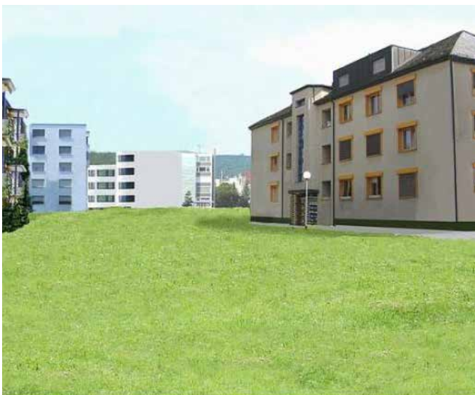
Vergleichsweise eintönige Gestaltung mit geringem Wert für die Biodiversität

Dieser Leitfaden soll Grundsätze, Handlungsfelder und konkrete Massnahmen für ein attraktives, vielfältiges und lebenswertes Siedlungsgebiet aufzeigen. Er ist unterteilt in drei spezifische Kapitel für Gemeinden, Privatpersonen und Unternehmen und beinhaltet einen umfassenden Massnahmenkatalog. Sämtliche Akteure haben es in der Hand, etwas für die Biodiversität zu tun. Bereits kleine Massnahmen können viel Positives bewirken. Helfen auch Sie mit!