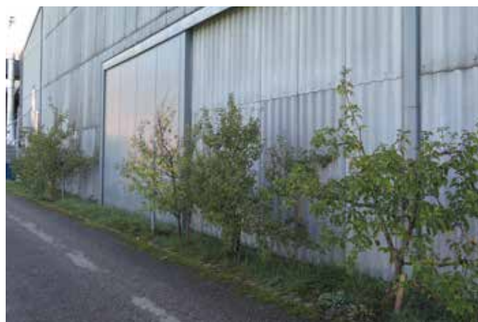
Grünstreifen der Zimmerei Holzbau Meier+Brunner AG