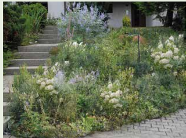
Aus einem naturfernen Schottergarten kann ein buntes Wildstaudenbeet entstehen