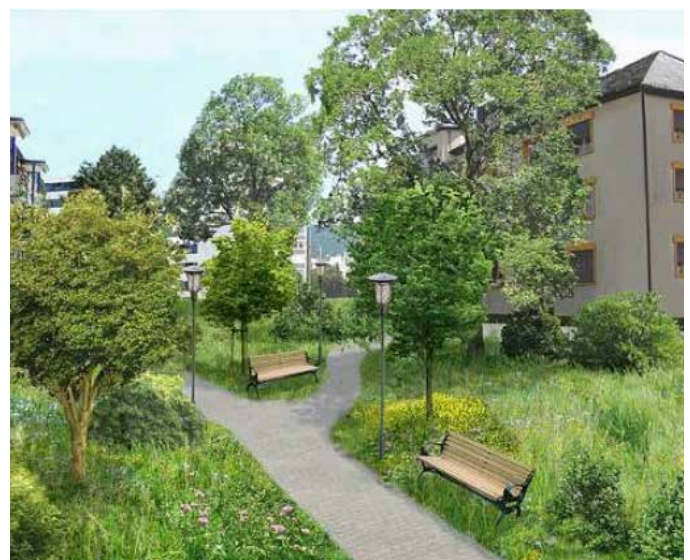
Naturnahe Gestaltung mit positivem Effekt für Mensch und Tier