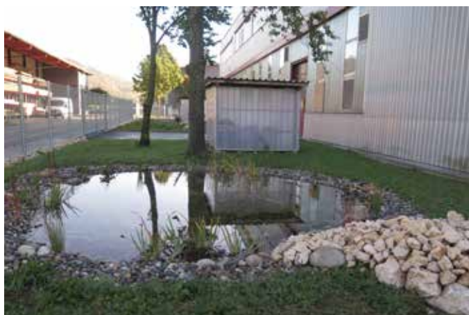
Firmenareal der PWF Kunststofftechnik AG

Der Aussenbereich einer Firma ist ein wichtiger Ort für die Mitarbeitenden. Eine attraktive und naturnahe Gestaltung erhöht die Aufenthaltsqualität und bietet Raum für Pausen und Erholung. Zudem bieten Grünräume auch wichtige Lebensräume für selten gewordene Tier- und Pflanzenarten.