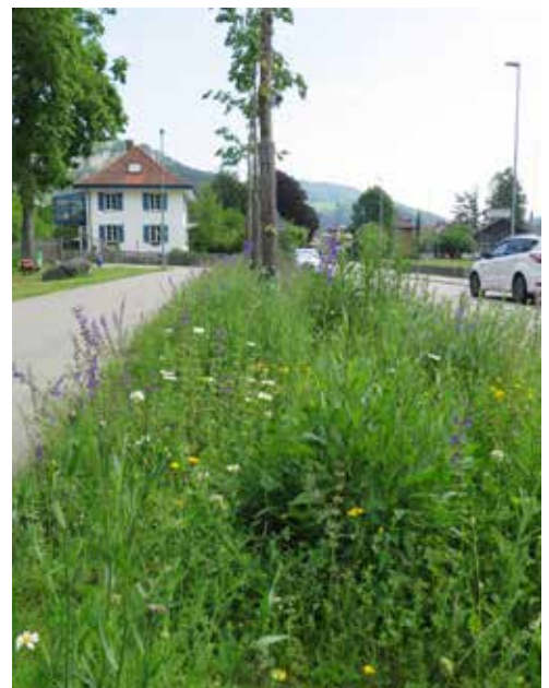
Rabatten mit Wildblumen